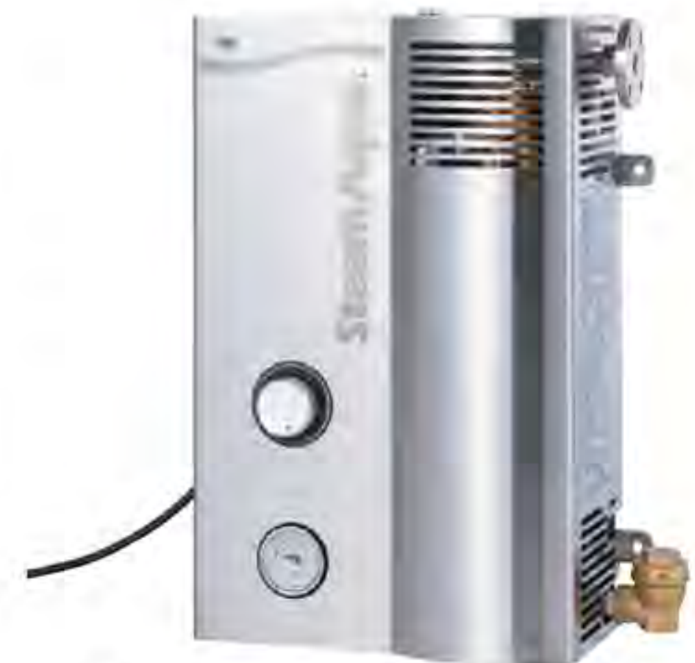
壁かけ式小型蒸気式温水製造ユニット「SteamAqua SQ-C04 / SQ-C06」

て水を間接加熱して所定温度の温水を作る瞬間給湯器。2008年の発売以来、これまで製品のブラッシュアップが重ねられている。