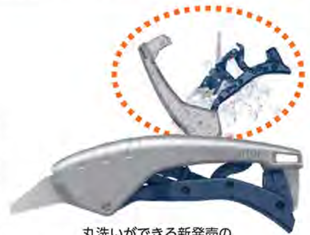
丸洗いができる新発売の「セキノーム610XDR」

開封、段ボール開梱、PPバンドのカットなどで使用でき、これ1本でほとんどの開梱・開封作業が可能。使用後はカッター内部の細かい部分まで掃除ができ、丸洗いも可能。グリップを離すと刃が自動で収納されるため、カッター未使用時の切創事故を防げる。2024年夏発売予定。