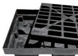
取り外しできる格子板