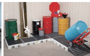
オプションでスロープを取り付けることができます