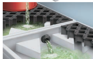
連結して隣接デッキに液体を流せません