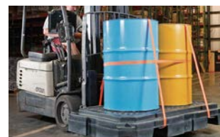
ドラム缶を乗せたまま移動が可能