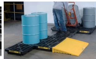
オプションでスロープを取り付けることができます (J28655, J28657)